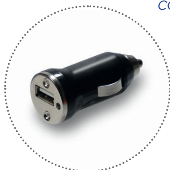
USB car charger (12/24V)

COMPLETA DI 2 CARICATORI COMPLETE WITH 2 CHARGERS