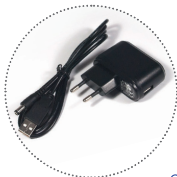
100/240V USB charger