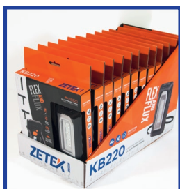
DISPLAYER 12 PCS